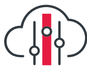
Hybrid Cloud & Datacenter