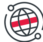
Network & Security

Gemeinsam wollen wir neue Ideen entwickeln, mutig größer denken und visionäre, digitale Lösungen finden.